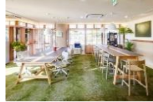
コワーキングルーム

出発日・旅行代金・支援額・地域共通クーポン・お支払実額(1~4名1部屋利用 おひとり様) 1泊夕・朝食付き