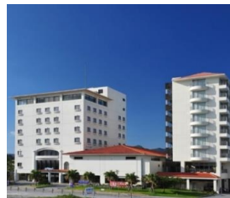
写真はすべてイメージです

お支払実額(大人おひとり) 3,900円~15,000円 (1泊朝食付/平日:月~木)・(1泊2食付金・土・日)