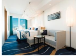
スタンダードルーム