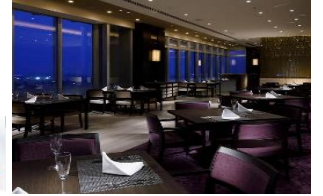
写真はすべてイメージです

出発日・旅行代金・支援額・地域共通クーポン・お支払実額(1~3名1部屋利用 おひとり様) 1泊2食付又は1泊朝食付