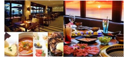
Wine & Dining The Oranji