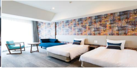
スーペリア42~44㎡ (3~4名部屋)